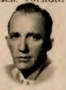
Bing Crosby, 2.5.

STIER: Sie sind unzufrieden und voll Unrast. Ihnen fehlen Stunden der Besinnung. Warum suchen Sie immer den Trubel auf? Wenn Sie in einem Blumenbeet Tag und Nacht umrühren, wächst nicht mal die Petersilie.